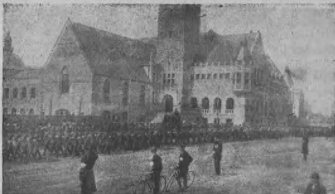
Valkoinen armeija saapuu Helsinkiin.

kansan yhteinen hätä jo vaatii suurten riistäjain tuotantolaitostenkin ottamista yhteiskunnan haltuun, väistyköön heidän omistusoikeutensa.“