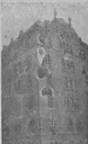
Saksalaisten tykinluolien lävistämä rakennus Helsingissä.

„Meidän mielestämme on nyt Suomessa pyrittävä rohkein, harkituin ottein muuttamaan koko valtiojärjestystä. Virkavalta on nyt niin murrettava, ettei se enää myöhemminkään voi kansan herraksi päästä. Tuomioistuintenkin itsevaltiudesta on tehtävä kertakaikkiaan loppu. Koko valtiosääntö taatusti perustettava työväen etujen mukaisen kansanvallan pohjalle. Veroja ja rasituksia on siirrettävä vähävaraisten hartioilta rikkaiden riištäjien kannettavaksi. Vanhain ja työkyvyttömiä vakuutus laetava käytännössä jo ennen kuin varsinainen vakuutuslaki ennättää tulla säädetyksi. Kansanvalistusasian johdosta on hävitettävä taantumuksellisuus. Torpparit ja mäkitupalaiset heti vapautettava isäntiensä vallasta. Vieläkin syvemmältä käytävä kapitalismin riištöjärjestelmään käsiksi. Pankkipääoma alistettava yhteiskunnan valvontavaltaan ja sen kautta päästävä mahdollisimman pian pitämään kurissa teollisuus ja kauppa-pääomaa. Vähävaraisten omaisuuteen ei ole kajottava, mutta millä alalla