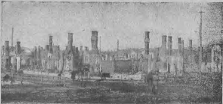
Sodan jälkiä Tampereella.

»Vastavallankumouksellisia» vastaan ryhdyttiin tehokkaisiin toimenpiteisiin. Toimeenpantiin lukuisia vangitsemisia. Kiellettiin kokoukset ja painovapaus. Ei edes puolueen omassa keskuudessa ilmeneviä erimielisyyksiä sallittu tuoda esille.