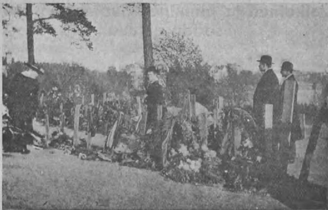
Punakaartilaisien hautoja Mäntymäellä Helsingissä.

tuaan kansalaissodassamme, päättyi maaliskuun 18 päivänä punaisten tappioon, jolloin alkoi heidän perääntymisensä, josta seurauksena oli pari viikkoa myöhemmin Tampereen menetys. Tällä välin kehittyivät sotatoimet nopeassa tahdissa. Siihen vaikutti, paitsi kurin höltyminen punaisen armeijan keskuudessa, myöskin ulkoapäin tulleet voimat. Sen vuoksi, että taistelu näytti pitkistyvän eikä pikaisia voiton mahdollisuuksia ollut olemassa, kääntyi Suomen hallitus avun pyynnöllä Ruotsin hallituksen puoleen. Täältä ei kuitenkaan tullut sellaista avustusta, jota valkoinen armeija kaipasi. Ruotsalaiset miehittivät kyllä Ahvenanmaan, mutta sillä ei ollut suurta sotilaallista merkitystä. Nyt kääntyi hallitus Saksan hallituksen puoleen, jonka kanssa syntyikin sopimus joukkojen ja sotatarpeitten lähettämistä Suomeen. Niin pian kuin saksalaiset saapuivat, kohtasi punakaarteja tappio toisensa jälkeen. Helsingin, josta Kansanvaltuuskunta oli jo paennut Viipuriin ja sieltä hyvissä ajoin