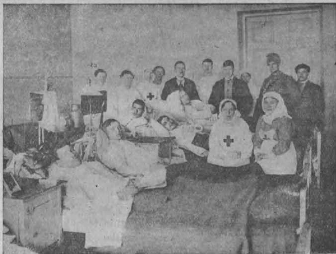
Punaisen armeijan sotilassairaala Vilpurissa.

Näistä epäilemättä tärkein oli sopimus Venäjän ja Suomen välillä, jonka kautta »Suomen sosialistinen tasavalta», jonka nimen Kansanvaltuuskunta maallemme antoi, luovutti Venäjälle erinäisiä alueita ja sai siltä osan Jäämeren rannikkoa. Näitä paitsi valmisti Kansanvaltuuskunta ehdotuksen Suomen valtiosäännöksi, joka kuitenkin jäi — kuten tunnettua, saattamatta voimaan.