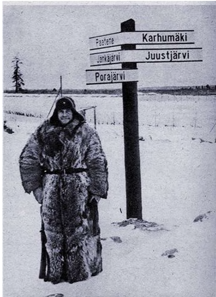
Suomen mies tietää tehtävänsä ja seisoo lujalla pohjalla.

No, tarvitseeko tällaista propagandaa sitten kuunnella, eihän siitä ole ainakaan mitään hyötyä. Tottahan se on, ei sitä tarvitse kuunnella, ja joutaapa sen kuuntelu jäädäkin. Ei se ainakaan hyödytä ketään. Mutta ei sitä ole syytä valtion kieltää rangaistuksen uhalla enempiä kuin tässäkin kielellä, sillä tiedämme hyvin, että kielletyn puun hedelmä on makea. Jos nappuloiden vapaan kääntelemisen oikeus lailla kiellettäisiin, saattaisivat tyhimmät meistä luulla, että valtio haluaa kansalaisia estää kuulemasta totuutta, ja seurauksena olisi, että noita hyödyttömiä