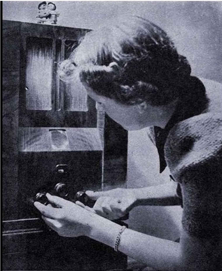
Meillä on lupa käännellä vapaasti radiomme nappuloita. Vieras propaganda ei pysty lyömään lovea käsityksiimme, sillä olemme vuoren varmoja asiamme oikeudesta.

Tämän kirjoittaja joutui jonkinlaisessa 'ominaisuudessa' loppukesän aikana päivästä päivään seuraamaan suomalaisen sotilassairaalan elämää. Tässä nyt ei tule kysymys muusta kuin sairaalan asukkaiden ajanvietteistä. Ylimpänä niistä on mainittava uutislähetysten kuunteleminen. Radio oli yleensäkin suosiossa, mutta suomalaisten uutisten aikana radio eritoten pauhasi täyttä menoa. Yhtä innokkaasti kuunneltiin myöskin ryssän suomenkielisiä uutis- ja propagandalähetyksiä. Varsinkin Tallinnan aallolla puhuva suomenkielinen nuori lurjus oli kuuntelijoiden eräänlaisessa suosiossa: hänen sanomaansa ei yleensä päästetty kuuntelematta ohitse. Ja olikin se tallinnalainen maanpetturi aika poika! Se, mitä hän tolkutti, oli tyypillistä Tiltun puhetta, tavallisia törkeämpää vain. Paljon kiukustuttavampaa kuin tuo jo kaikille tutuksi tullut löpinä 'tanner-mannerheimiläisestä diktatuurista' oli kuuluttajan ääni ja esitystapa. Pojan ääni oli todellakin niin raaka ja ärsyttävä ja hänen esitystapansa niin raivostuttavan hävitön, että kätensä menettäneet invaliditkin sanoivat puristavansa kätensä nyrkkiin ja huitelevansa ajatuksissaan swingejä vasten puhujan koiramaista pärsää.