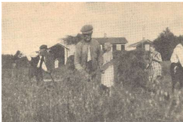
Ahkeran työn siunaus. Suomen nykyinen yhteiskuntajärjestys suojaa kaikki kansalaisensa ja turvaa työrauhan.

Ilman isänmaallisen kansanosan vääjäämätöntä tahtoa taistella kaikella lain ankaruudella tätä liikettä vastaan, ilman tinkimätöntä tukea hallituksen ja viranomaisten toimenpiteille rikollisiksi osoitettavien kommunististen toimintamuotojen ja koko kommunistisen liikkeen ehkäisemiseksi, ja, niinkuin on osoittautunut, ilman lakien tehostamista ei valtiolta kykene torjumaan kyllin tehokkaasti tätä uhkaavaa vaaraa.