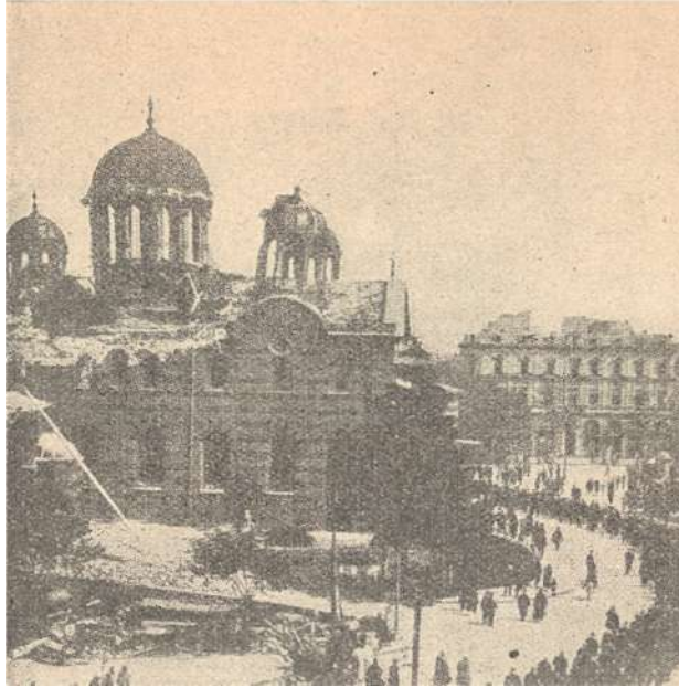
Kommunistien "julkista" toimintaa.

Surujumalanpalveluksen aikana, johon otti osaa hallituksen jäsenet ja diplomaattikunta, heittivät kommunistit pommin Sofian tuomiokirkkoon v. 1925, surmaten 123 ja haavoittaen 323 läsnäolijaa. Teko oli suunniteltu ja johdettu Venäjältä.