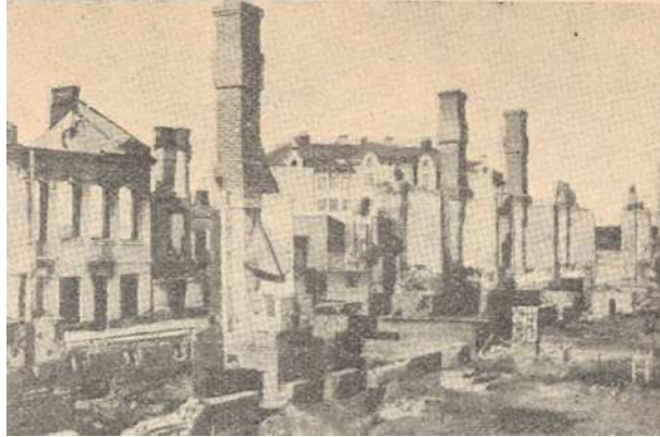
Synkkä kuva Tampereelta. "Yhtenäisen, lujan vallankumouksellisen taistelurintaman" jälkiä vuodelta 1918.

vehdys 1929 Suomen luokkatietoiselle työväelle, jota viranomaiset onnistuivat monituhantisen lähetyksen takavarikoimaan, päättyi m.m. seuraaviin tunnuksiin: