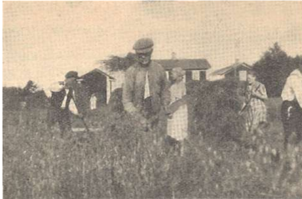
Ahkeran työn siunaus. Suomen nykyinen yhteiskuntajärjestys suojaa kaikki kansalaisensa ja turvaa työrauhan.

Ilman isänmaallisen kansanosan vääjäämätöntä tahtoa taistella kaikella lain ankaruudella tätä liikettä vastaan, ilman tinkimätöntä tukea hallituksen ja viranomaisten toimenpiteille rikollisiksi osoitettavien kommunististen toimintamuotojen ja koko kommunistisen liikkeen ehkäisemiseksi, ja, niinkuin on osoittautunut, ilman lakien tehostamista ei valtiovalta kykene torjumaan kyllin tehokkaasti tätä uhkaavaa vaaraa.